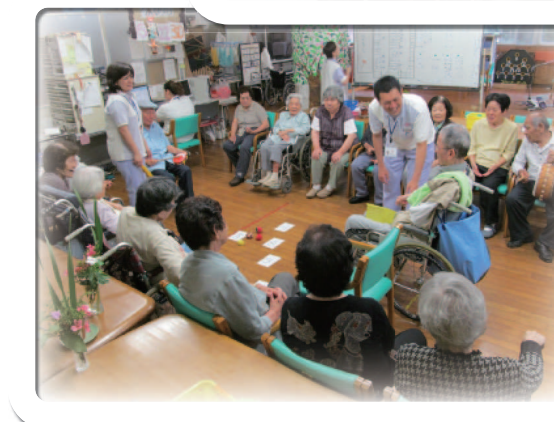
通所リハビリテーション